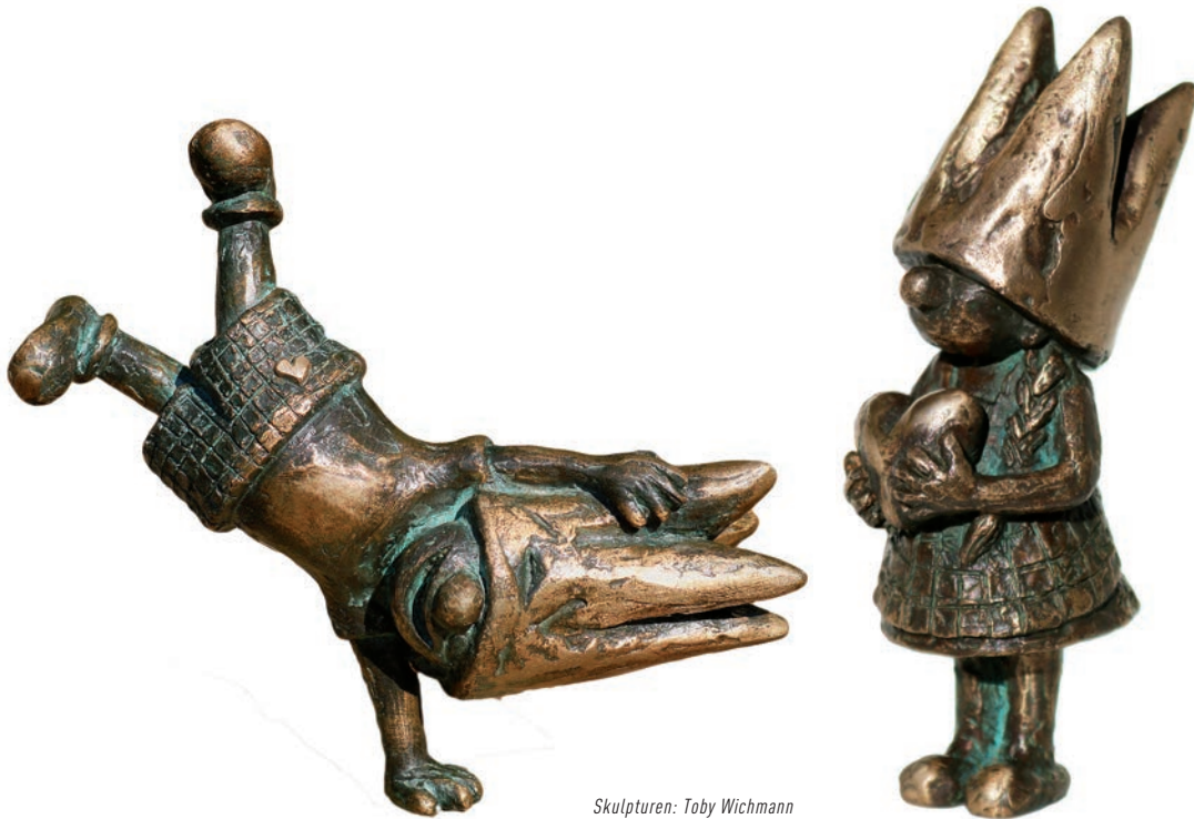
Skulpturen: Toby Wichmann

BOTANISCHER GARTEN KREFELD · 04. + 05. MAI 2024 SCHLOSS MOYLAND · 21. + 22. SEPTEMBER 2024